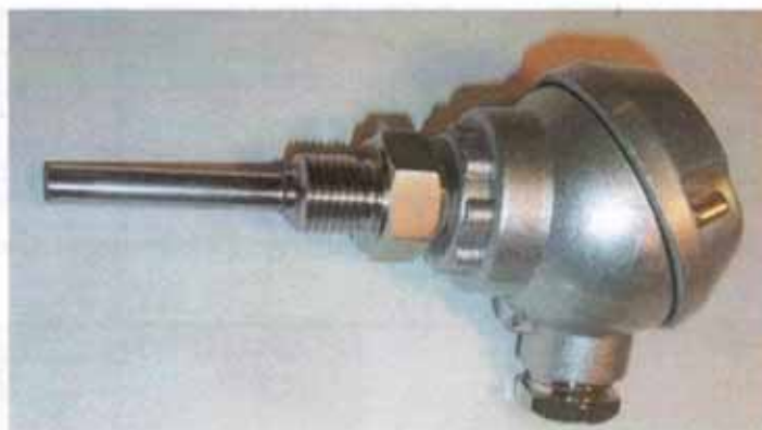
Рисунок 3 - Общий вид термопреобразователей сопротивления платиновых модели 2xxJ модификации 211J