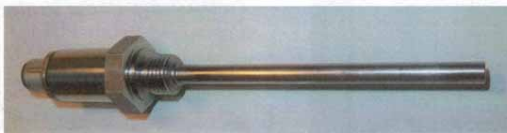
Рисунок 12 - Общий вид термопреобразователей сопротивления платиновых модели 211Vi