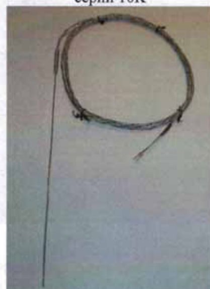
Рисунок 10 - Общий вид термопреобразователей сопротивления платиновых модели 21M