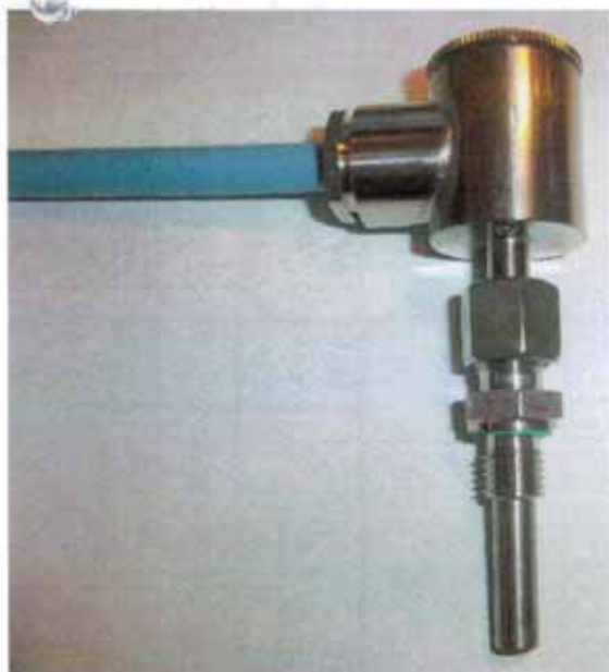
Рисунок 12 - Общий вид термопреобразователей сопротивления платиновых модели Ex2xx модификации Ex223