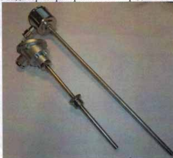
Рисунок 2 - Общий вид термопреобразователей сопротивления платиновых модели 2xx модификаций 221и 212BR55

Фотографии общего вида термопреобразователей представлены на рисунках 1-15.