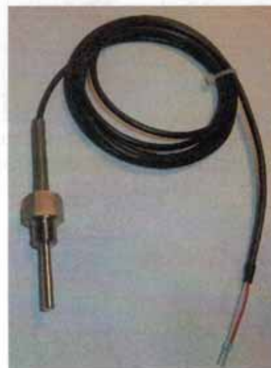
Рисунок 6 - Общий вид термопреобразователей сопротивления платиновых модели 26x модификации 26G