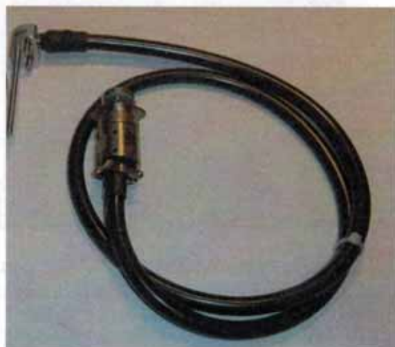
Рисунок 8 - Общий вид термопреобразователей сопротивления платиновых модели 21wx модификации 21w5