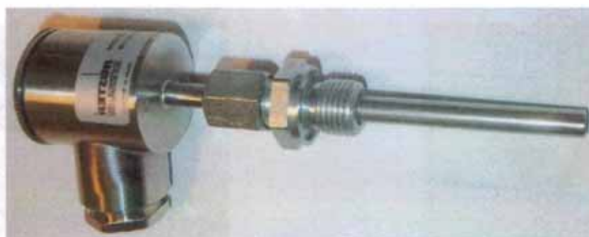
Рисунок 4 - Общий вид термопреобразователей сопротивления платиновых модели 2xxBR модификации 212BR30