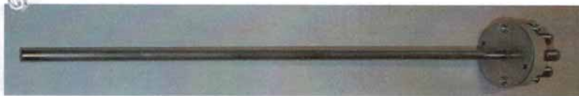
Рисунок 7 - Общий вид термопреобразователей сопротивления платиновых модели 20 (20M)