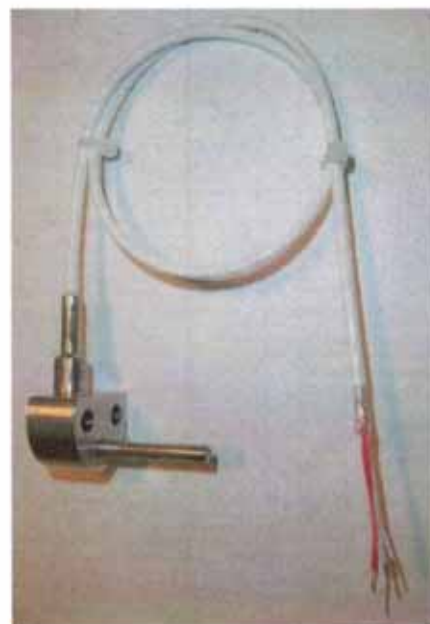
Рисунок 13 - Общий вид термопреобразователей сопротивления платиновых модели Ex21w