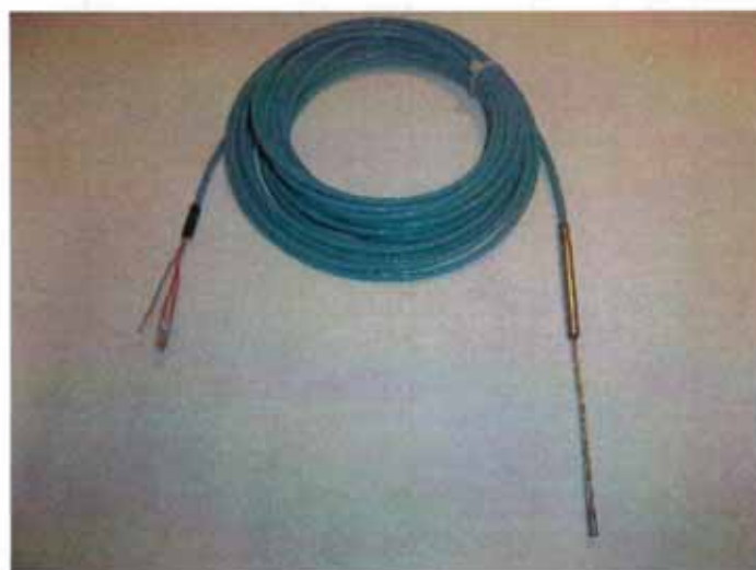
Рисунок 15 - Общий вид термопреобразователей сопротивления платиновых модификации Ex21A